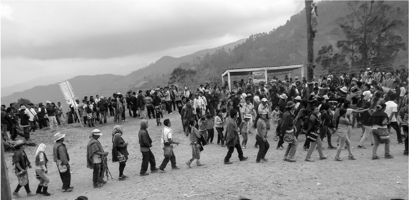
Fotografía 2. Comunidad nasa danzando en el Saakheluu. Resguardo de Pioya (Caldono-Cauca).

le ha otorgado los ancestros para que sea el mediador entre la naturaleza y el hombre, para que tuviese vocación de servicio a la comunidad y para que misionara en pro de la colectividad mediante las virtudes de las plantas medicinales para mantener en equilibrado la casa grande (Madre Tierra) mediante la espiritualidad con los demás seres de la naturaleza, (Molina Bedoya, 2013).