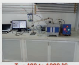
T_{ca} : 400 to 1000 °C